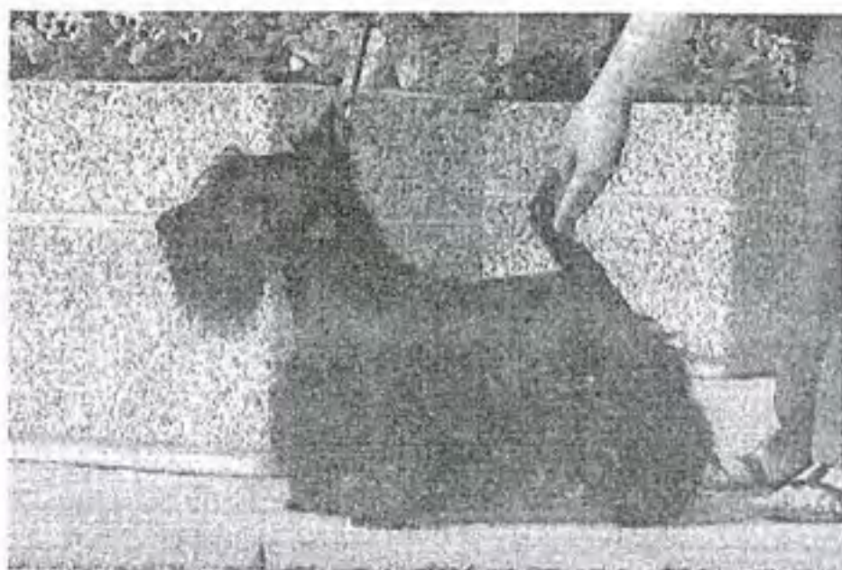
Penjetta Highland Ghillie

Сообщаем, что 25 августа произошла вязка о. Чемпион России, РКФ PENJETTA HIGHLAND GHILLIE (Англия) ( Eng CH Mayson Limited Edition (Англия) x Lucia's Dream Stir Me Up (Голландия)) м. Чемпион России, Беларуси КАТЕРИНА ОТ СКОРОБОГАТОВЫХ ( Int CH Feregait Dirty Harry (Англия) x Rus CH Екатерина от Скоробогатовых)