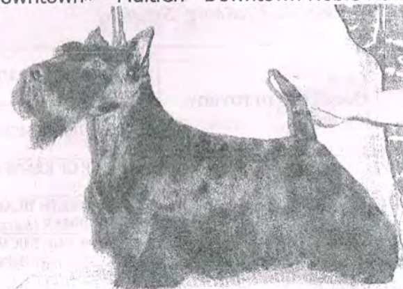
на фото 12 месяцев

представляет импортированного из Германии молодого перспективного кобеля черного окраса DOWNTOWN TOBAGO рожд. 29.01.02, (Ch. Downtown Trinidad x Downtown Xtra Applause), инбредный 2-2 на лучшую производительницу питомника «Downtown» - MultiCh Downtown Noble Nancy