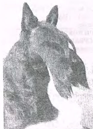
фото Скоттиш Тауэр Жанна Д`Арк